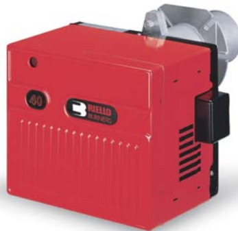
• Série 40 FS (gás) / 40 G (óleo)