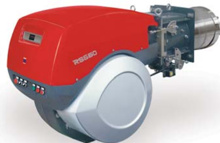
• Série RS (gás) / RL (óleo) / RLS (dual)