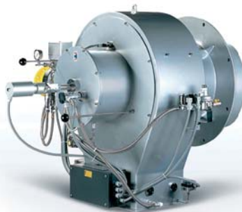
• Série ER